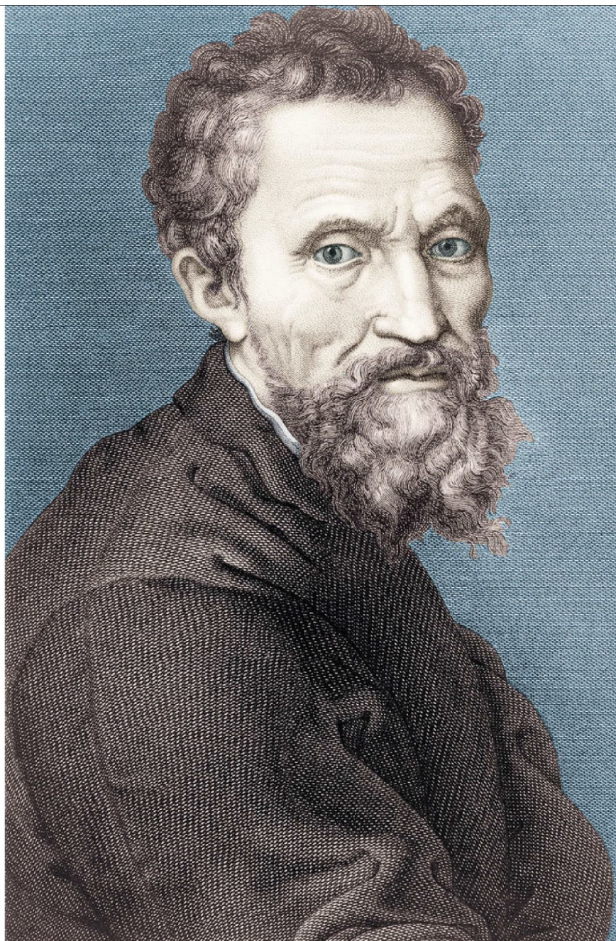
Miguel Ángel. Retrato. Grabado

Si la biografía de una persona es lo que es su final, había que detenerse en los últimos 30 años de la vida de Miguel Ángel. Muchos estudiosos piensan que la pintura de 'El Juicio', junto con las últimas Piedades y las vicisitudes en torno a los trabajos de dirección de la Ba-